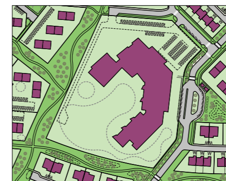
Skýringarmynd Mkv. 1:5000

Framkvæmdastjóri / bæjarstjóri Sveitarfélagsins Árborgar: