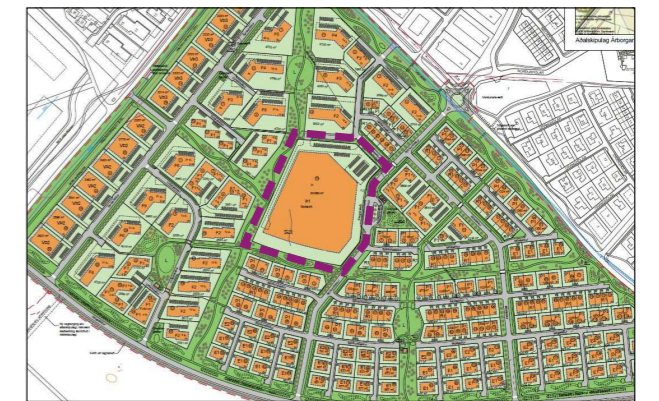
Staðsetning breytingar sýnd í samhengi við hverfið